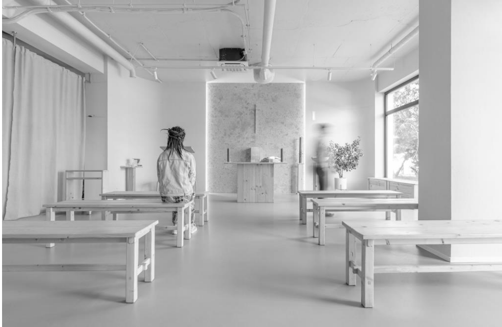
fot. 2 Wnętrze kaplicy Parafii Imienia Jezus w Poznaniu, Polska, proj. Bidermann+Wide