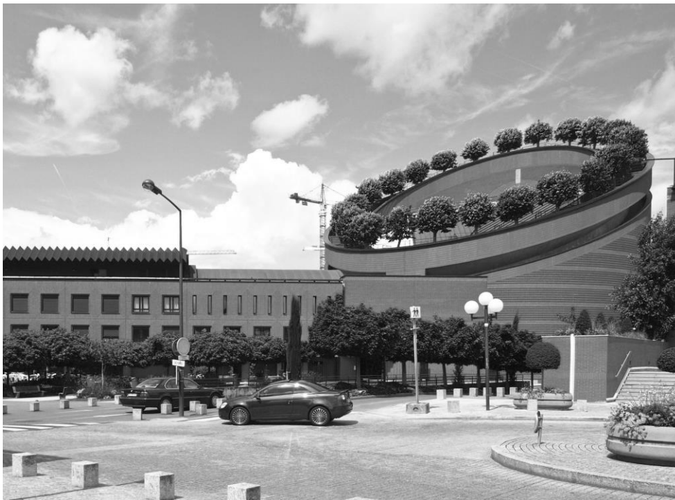
fot. 4 Katedra pw. Zmartwychwstania Pańskiego w Évry, Francja, proj. Mario Botta Architeti, fot. Autor

architektury nurtu anty-monumentalnego. Wydaje się, że podobny zarzut pod względem formy zewnętrznej można by wysnuć wobec jednej z największych katedr na świecie – pw. Najświętszej Maryi Panny w Los Angeles projektu Rafaela Moneo (1996-2022).